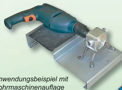
Anwendungsbeispiel mit Bohrmaschinenauflage

Bestellnummer Bohrmaschinenauflage: 11012310