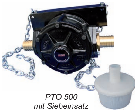
PTO 500 mit Siebeinsatz