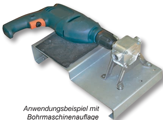
Anwendungsbeispiel mit Bohrmaschinenauflage