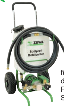
für blasenfreie Befüllung des Kühlkreislaufs mit Frostschutzmittel: Spülprofi Mobilcenter