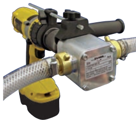
zum Nachimpfen von Frostschutz- mittel beim Kühlkreislauf des Motors: Bohrmaschinenpumpe