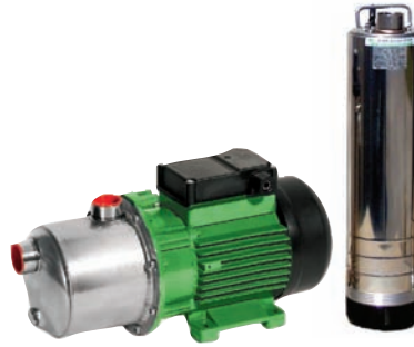
für Wasserversorgung und Druckerhöhung: Kreiselpumpen, Brunnenpumpen