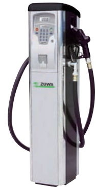
zum Betanken: Dieselpumpen, Betriebstankstellen und Betankungssets