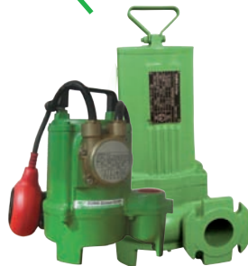
für Kondenswasser: Schmutzwasserpumpen (auch ATEX-konform)